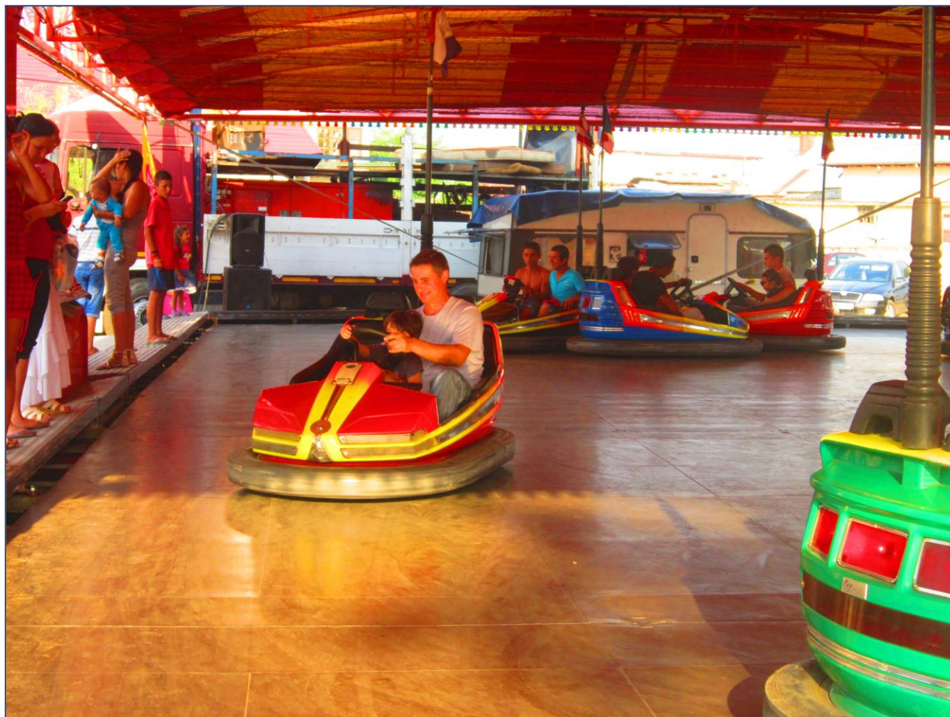
Dărmănești 2012; Bâlciul de Sfântul Pantelimon.

Părinții și copiii se bucură împreună de facilitățile moderne oferite lor în cadrul sărbătorii tradiționale a comunei în care locuiesc. Un nou prilej de a interacționa și a petrece timp împreună!