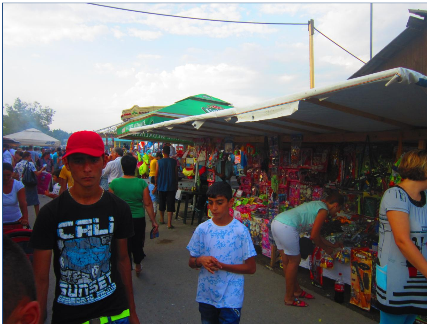
Dărmănești 2012; Bâlciul de Sfântul Pantelimon

Bâlciul tradițional al comunei Dărmănești organizat în fiecare an de Sfântul Pantelimon aduce laolaltă oameni diferiți de vârste diferite, fiecare găsind aici ceva pe placul său. Tradiția se menține și în zilele noastre.